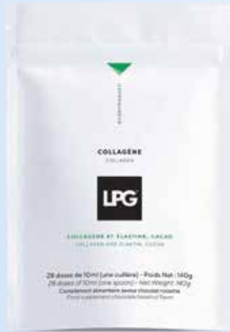
Prodejní balení: 28 sáčků v obalu

Zředte 1 odměrku ve 100 ml horké vody, teplého (rostlinného nebo živočišného) mléka, kávy nebo jiného požadovaného nápoje.